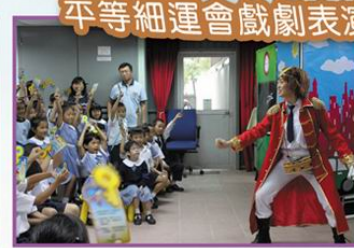
平等細運會戲劇表演