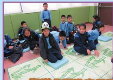
海洋公園教室學習