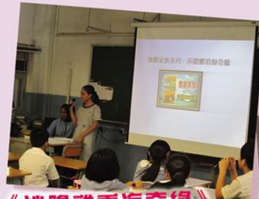
《沙騰雞看海奇緣》又是一個怎樣的故事呢？

友校喇沙中學學生到校，以生動有趣的講解，引發四、五年級的同學發掘不同範疇的閱讀興趣。