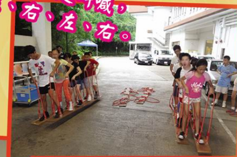
大家一起叫喊，左、右、左、右。