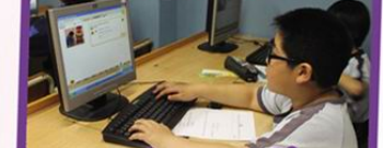
Enrichment Class 英文拔尖班

Students are learning English by playing internet games.