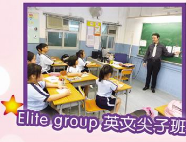
Elite group 英文尖子班