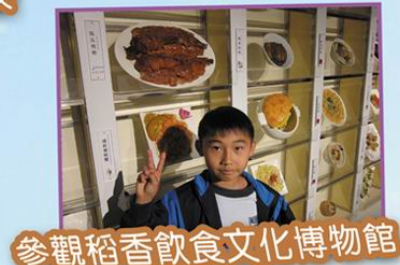
參觀稻香飲食文化博物館