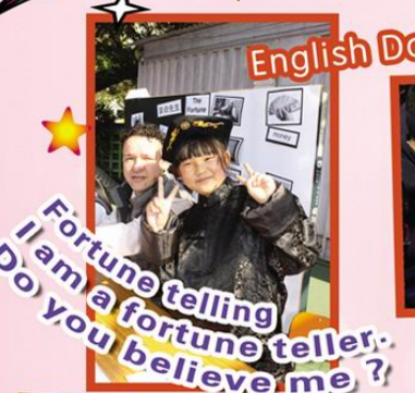
Fortune telling I am a fortune teller. Do you believe me?