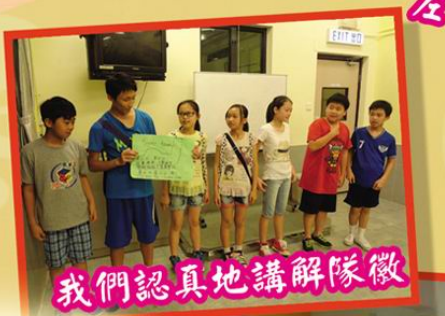
我們認真地講解隊徽