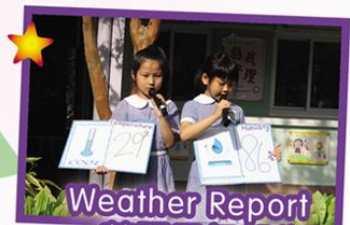
Weather Report 英語天氣報告

Our English programmes create the chance for students to use vivid and interesting English for communication.