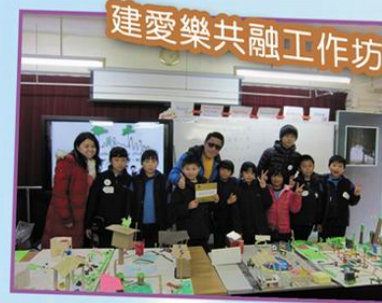
建愛樂共融工作坊