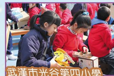
武漢市光谷第四小學 訪校交流