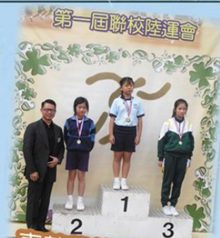
第一屆聯校陸運會 東莞學校和本校 聯校陸運會