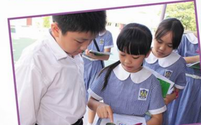
五年級學習使用指南針