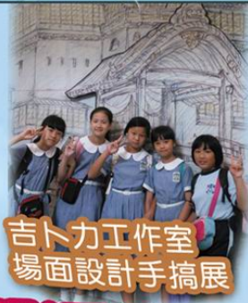
吉卜力工作室 場面設計手搞展