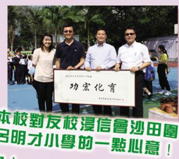
本校對友校浸信會沙田圍呂明才小學的一點心意！