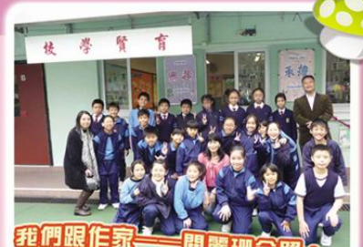
我們跟作家——關麗珊合照，很興奮啊！