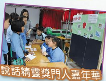
說話精靈獎門人嘉年華