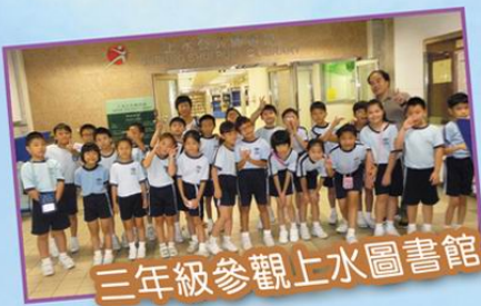
三年級參觀上水圖書館

「讀萬卷書不如行萬里路」，這是鐵一般的事實。全方位學習為學生帶來多元化的學習空間，多一次活動，多一分體驗，多一分知識！