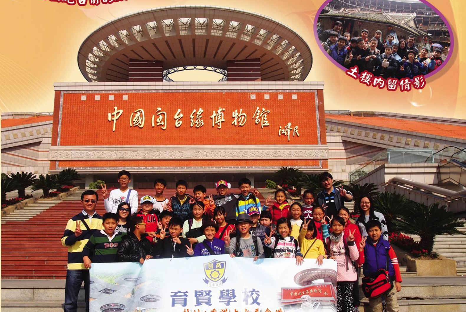
中國閩台緣博物館