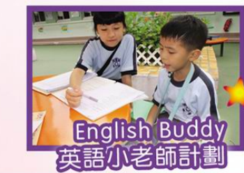
English Buddy 英語小老師計劃