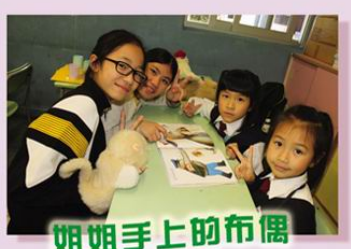
姐姐手上的布偶會說故事的

除老師身體力行，推動閱讀外，本校更與不同友校舉辦閱讀活動，交流心得，讓孩子的閱讀天地變得更廣闊。浸信會沙田圍呂明才小學學生，爲本校一年級的同學製作英語故事書，鼓勵他們創作英語詩歌。