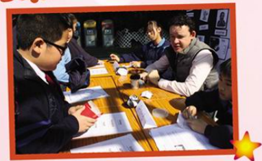
Home Reading Scheme 英文親子閱讀計劃