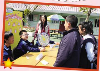
Look! I have finished my worksheet. I can get a prize.