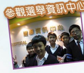
參觀選舉資訊中心