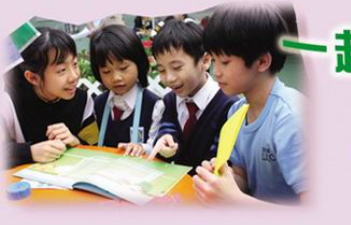
一起看書，一起歡笑

除老師身體力行，推動閱讀外，本校更與不同友校舉辦閱讀活動，交流心得，讓孩子的閱讀天地變得更廣闊。浸信會沙田圍呂明才小學學生，爲本校一年級的同學製作英語故事書，鼓勵他們創作英語詩歌。