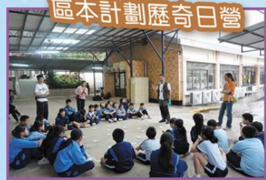
區本計劃歷奇日營