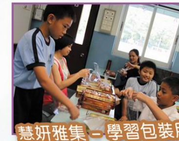
慧妍雅集 - 學習包裝月餅