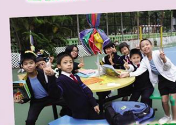
成功，又看完一本英語圖書！