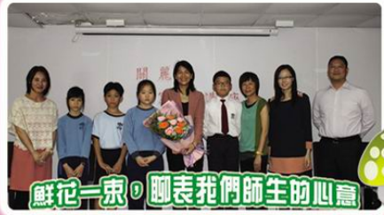
鮮花一束，聊表我們師生的心意

本校一向積極推動寫作風氣，除舉辦校內寫作班外，更鼓勵學生參加不同的寫作活動，讓學生得以交流及提高寫作能力。為學生有機會向成名作家汲取寫作經驗，本年度特意邀請作家關麗珊到校舉辦寫作班及講座，讓學生學習寫作技巧。