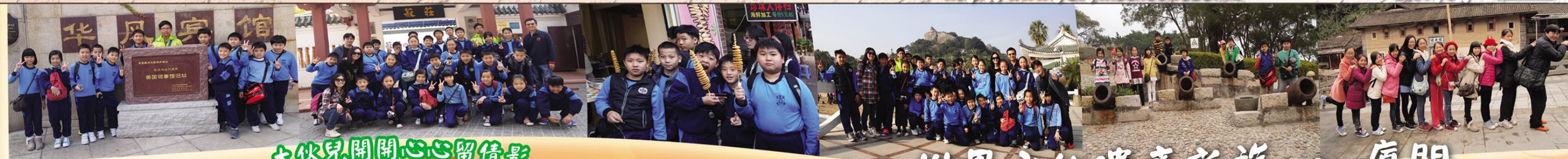
大伙兒開開心心留倩影