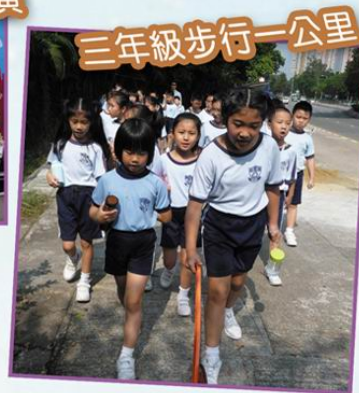
三年級步行一公里