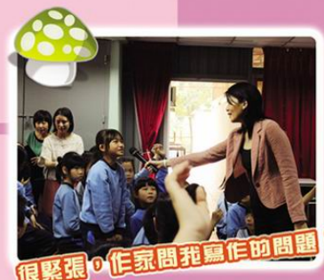
很緊張，作家問我寫作的問題！